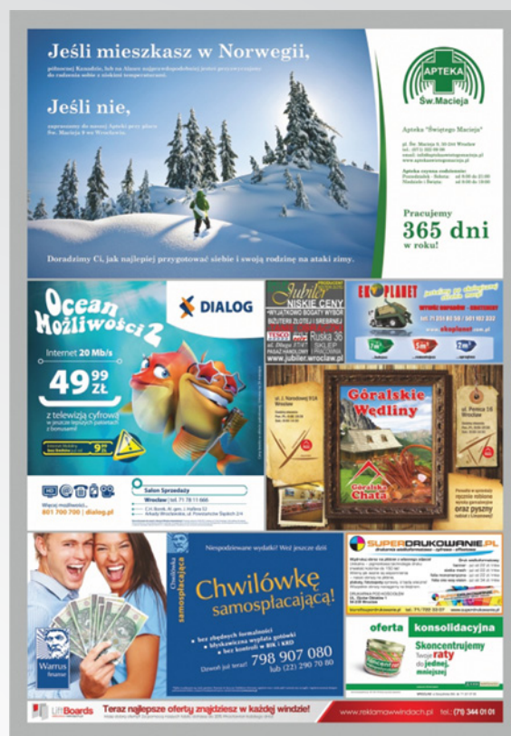
wizualizacja nośnika LIFTBOARDS